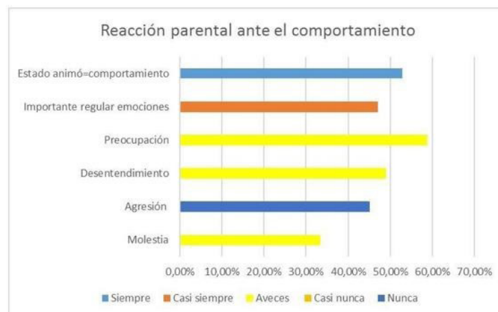
Figura 3. Reacción de los niños frente a una situación de conflicto (según sus padres) durante la emergencia sanitaria COVID-19.

Los resultados obtenidos en este apartado están relacionados a una conducta específica de los padres: el evitarles la frustración, el mismo que está ligado a la sobreprotección que también es un factor frecuente de acuerdo con lo obtenido en los datos expuestos. También es menester mencionar que, los padres solucionan los problemas de sus hijos lo que genera un problema de autonomía en los niños afectando a su desenvolvimiento. Finalmente, la relación parental es lo que menos afecta a los niños, debido a que en el contexto que ellos se desenvuelven es muy poco frecuente que exista conflicto entre los padres de familia.