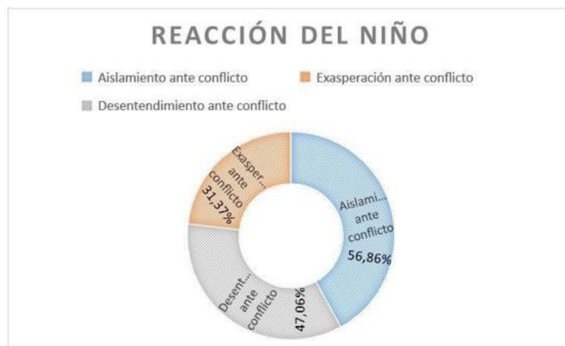
Figura 4. Reacción de los niños frente a una situación de conflicto (según sus padres) durante la emergencia sanitaria COVID-19.

Es muy común la existencia de problemas y conflictos en el hogar de cada niño; sin embargo, es importante estar atentos a la reacción del niño ante ellos. En los resultados obtenidos por medio del cuestionario, se puede evidenciar que el aislamiento es una conducta repetitiva ante la existencia de un conflicto, teniendo en cuenta que, debido a este, existirá la presencia del temor. Existen otras conductas reiterativas durante la presencia de un conflicto en el entorno cercano del niño, entre ellas los llamados “berrinches exagerados”. Y a su vez, otro comportamiento concurrente es la poca interacción con el medio o en su defecto el desentendimiento del problema.