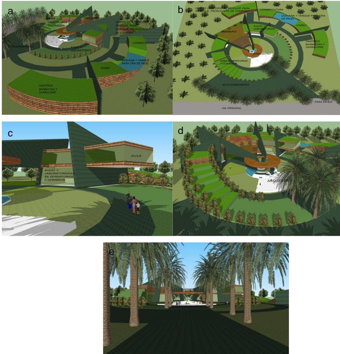
Gráfico 3. Diseño del conjunto arquitectónico CEFOCAP.

estructura y funcionamiento de los ecosistemas, lo cual favorece el control de insectos no benéficos, la conservación de la diversidad florística, funcional y organizacional.