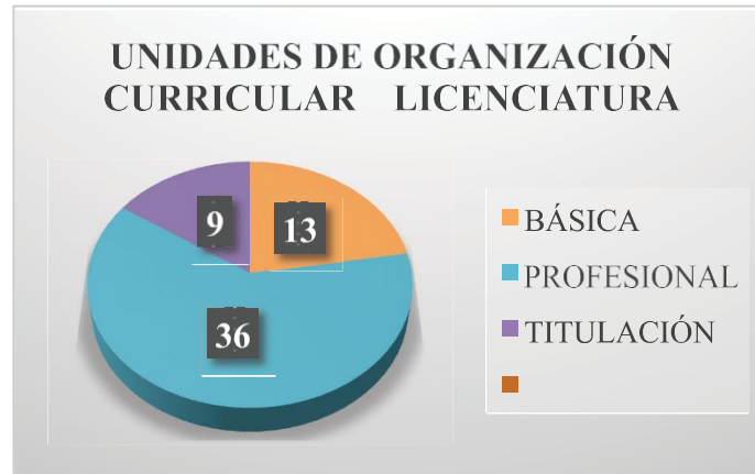
Figura 1 Unidades de organización curricular Licenciatura

Ausencia de sustentabilidad en las unidades curriculares de ingeniería y licenciatura en la carrera de Turismo