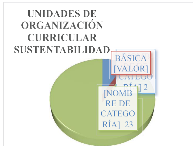
Figura 2 Unidades de organización curricular sustentabilidad